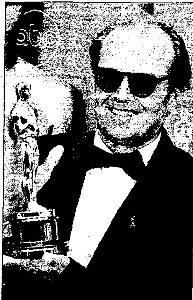
جاك نيكولسون، أفضل ممثل